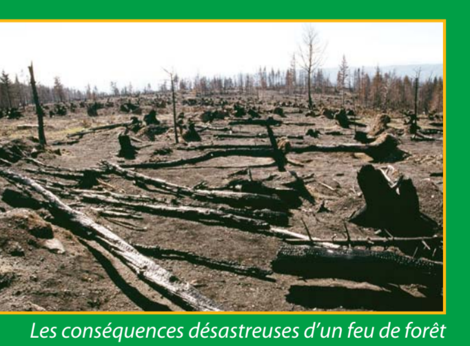
Attention au feu ! Les conséquences désastreuses d'un feu de forêt en Ardèche verte